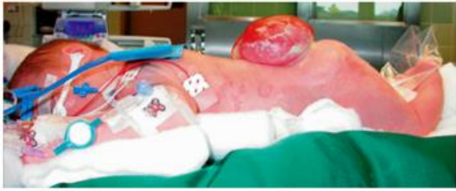
Figura 1. Malformação de uma espinha bífida aberta: mielomeningocele (MMC) de acordo com Biedermann 13

saúde da criança com diversas consequências, sobretudo com as mais comuns, como a paralisia, as alterações de sensibilidade no tecido epitelial de revestimento, o déficit para autocontrole de bexiga e as deformidades musculares 2 .