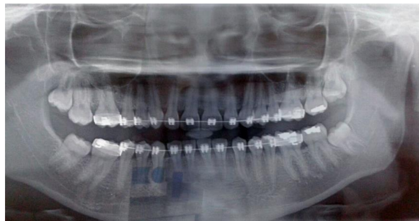
Figura 1: Imagem panorâmica evidenciando dente 38 semi-incluído com mesio-inclinação e íntima relação com o canal mandibular.

para remover o dente do alvéolo. Após as exodontias, foram feitas as suturas e prescrição de amoxicilina 500mg, por um período de sete dias, e nimesulida 100mg por três dias, além de recomendações pós-operatórias à paciente. A mesma, decorridos oito dias após a cirurgia, retornou para remoção das suturas, sem apresentar queixas.