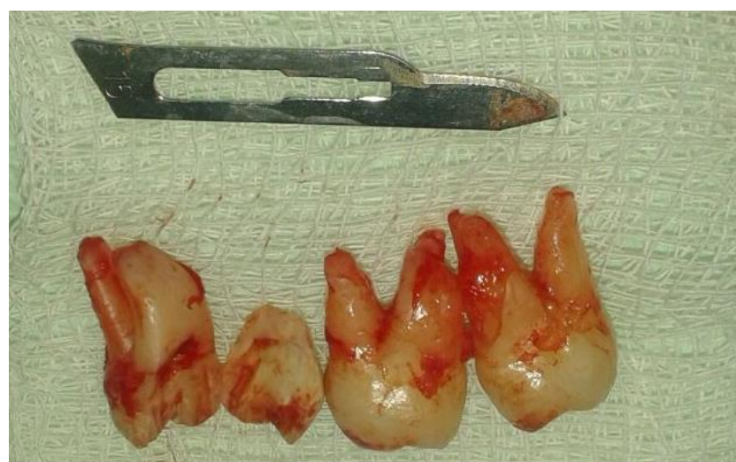
Figura 3: Dentes 18, 28 e 38 extraídos. Nota-se odontosecção do dente 38.