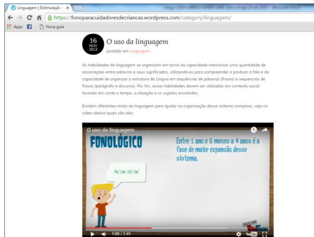
Figura 1: Arquivo da categoria: o uso da linguagem.

Para ilustrar o uso da linguagem em seus diferentes níveis (pragmático, fonológico, semântico e sintático) foi criada uma animação pelo instrumento online Pow Toon, contendo figuras animadas, imagens e conteúdo escrito, com exemplos de cada nível e como esse se desenvolve na criança (Figura 1).