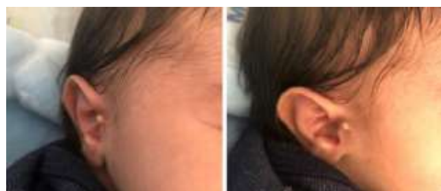
Figura 1: Apêndice pré-auricular, anteriormente à orelha externa direita.

com índice de massa corporal maior que 40 kg/m 2 durante os três trimestres da gestação. Possuía exame de hemoglobina glicada com valor de 11,5% no primeiro trimestre, além de tabagismo ativo pré-concepção. Fez uso de ácido acetilsalicílico, carbonato de cálcio, metildopa, metformina e insulina regular desde o início da gestação, com controle irregular de pressão arterial e glicemia. Ultrassonografias morfológicas e ecocardiograma fetal dentro dos parâmetros de normalidade, realizados conforme protocolo institucional. Não havia história familiar de doenças congênicas, síndromes familiares ou consanguinidade. Nascido de parto vaginal a termo, neonato do sexo masculino foi reanimado em sala de parto com ventilação por pressão positiva devido à hipotonia e ausência de drive respiratório, com melhora dos parâmetros clínicos, apresentando escala de APGAR 3/8. Ao exame físico primário, apresentou-se adequado para idade gestacional de acordo com o projeto INTERGROWTH-21 ST e foi evidenciado apêndice pré-auricular em lado direito (Figura 1). À palpação de abdome, não foi possível avaliar massas ou qualquer outra alteração, apresentando cordão umbilical com duas artérias e uma veia. Não havia qualquer outra anormalidade da propedêutica inicial 7 .